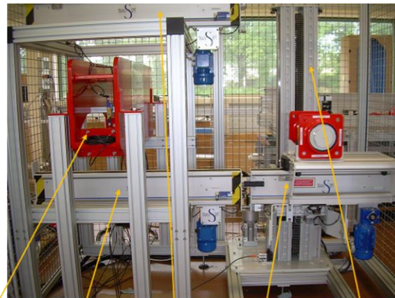
Poste de compression Convoyeur de test Convoyeur de stockage Convoyeur ascenseur Ascenseur

Problématique Transept : Conception modulaire d'un système de transitique pour charge lourde.